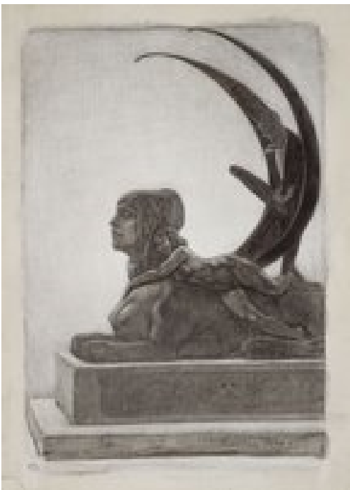
Félicien Rops, De Sfinx, zwart krijt, wit hoogsel, zwarte steen, penseel en grijs lavis, 27,7 x 20 cm. Collectie van het Musée d’Orsay.

In 1885 schrijft Rops aan zijn graveur, Léon Evely: “Het is belangrijk dat u de eerste 9 tekeningen voor De Duivelse Vrouwen in handen krijgt [...]. U weet dat die eerste tekeningen altijd iets unieks hebben.” En inderdaad, de tekeningen die Rops maakte voor De Duivelse Vrouwen stralen iets uit dat we niet meer terugvinden in de gravures die als reproducties zijn opgenomen in de boeken.