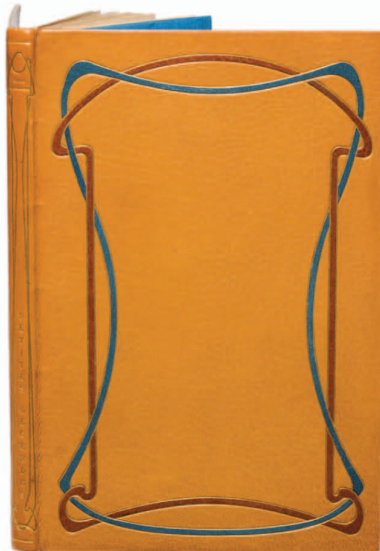
1. Belgische boekband in art nouveau-stijl, ontworpen door Henry Van de Velde en uitgevoerd door Paul Claessens in 1901 op VERHAEREN, Petites légendes (Brussel: Deman, 1900). Schenking, 2010