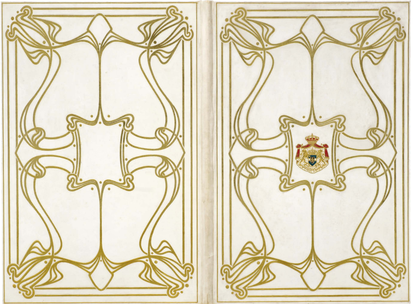
Belgische boekband in art nouveaustijl, ontworpen door Henry Van de Velde en uitgevoerd door Paul Claessens in 1898 voor een documentenhouder met daarop het wapenschild van de onafhankelijke staat Congo. Schenking, 2010

“Ik laat mijn collectie na aan mijn land, uit dankbaarheid omdat ik mijn levenswerk heb kunnen realiseren.”