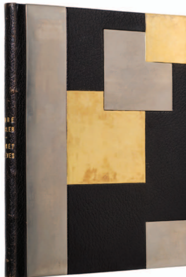
2. Parijse boekband in art deco-stijl met ingewerkte metaaldeeltjes, ontworpen door Robert Bonfils in 1927 op BEUCLER, Le Carnet de rêves (Parijs: Éditions du Raisin, 1927). Schenking, 2010