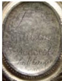
Ingekraste opschriften op de achterzijde van de dubbele cartouche.