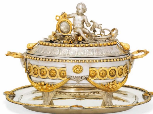
Joannes Cornelius Hendrickx, terrine, 1782 Aankoop, 2011, Zilvermuseum Sterckshof, Antwerpen

Deze reeks van vijf schilderijen sluit aan bij de zogenaamde woordschilderijen, waarbij taal- en beeldtekens onderlinge dialogen aangaan. In dit collectieve werk wordt de schrijver schilder en de schilder schrijver. Dergelijke werken werden voor de eerste keer gemaakt in het kader van de CoBRA-beweging, waarvan beide kunstenaars prominente vertegenwoordigers waren.