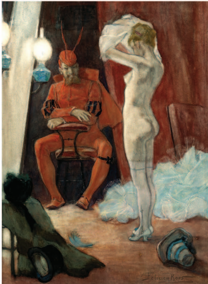
Félicien Rops, 'In de coulissen', ca. 1878-1880 Aankoop, 2008, Provinciaal museum Félicien Rops, Namen

Met zijn 'Album van de Duivel' wilde Félicien Rops het verhaal van zijn tijd brengen in halfnaakt en naakt; de heldenrol in de 'comédie humaine' was weggelegd voor satan. Het project werd nooit afgewerkt, maar 'In de coulissen' is een van de ontwerpschetsen die aantonen hoe Rops reflecteert over het thema. De schetsen kondigen zijn satanische periode aan.