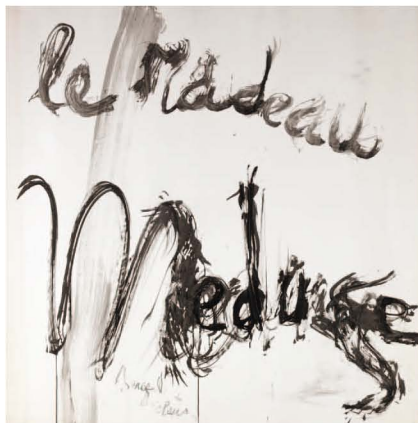
Hugo Claus en Serge Vandercam, Reeks 'Het vlot van de Medusa', 1964. Aankoop, 2008, Koninklijke Musea voor Schone Kunsten, Brussel

Dit uitzonderlijk geheel bestaat uit 85 stukken voornamelijk 18de-eeuws Brussels aardewerk. De verzameling ging van start in de 19de eeuw en werd van generatie op generatie overgedragen. Omdat een volgende generatieoverdracht de verspreiding van het geheel zou hebben betekend, besliste het Fonds eind 2010 de collectie in haar geheel aan te kopen.