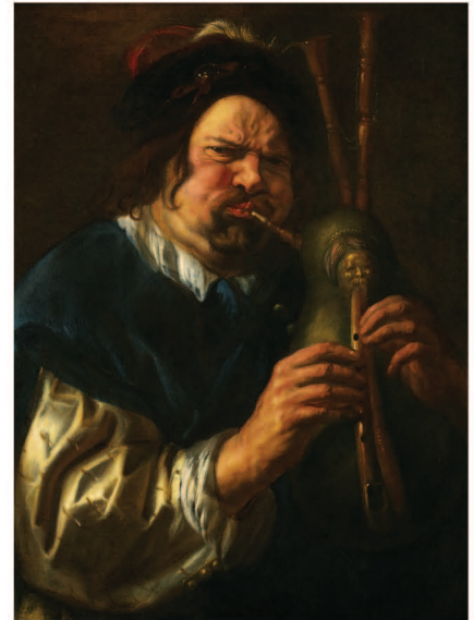
Jacob Jordaens, 'De doedelzakspeler', 1640-45 Aankoop, 2009, Rubenshuis, Antwerpen

Voor zover geweten is 'Oiseaux et Iris' de enige sierkam van Philippe Wolfers die nog volledig intact is. Het art-nouveauijuweel draagt het merkteken van de 'Exemplaires Uniques' en wordt in het originele schrijn bewaard, wat van dit juweel een bijzonder museumstuk maakt. Bovendien is het goed gedocumenteerd en bleef de ontwerptekening met datum bewaard.