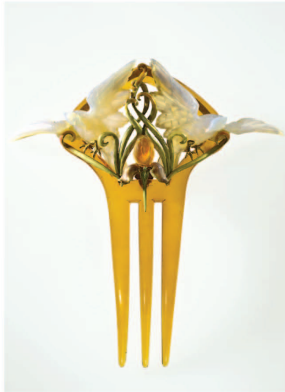
Philippe Wolfers, Sierkam 'Oiseaux et Iris', 1899 Aankoop, 2009, Koninklijke Musea voor Kunst en Geschiedenis, Brussel

Met zijn 'Album van de Duivel' wilde Félicien Rops het verhaal van zijn tijd brengen in halfnaakt en naakt; de heldenrol in de 'comédie humaine' was weggelegd voor satan. Het project werd nooit afgewerkt, maar 'In de coulissen' is een van de ontwerpschetsen die aantonen hoe Rops reflecteert over het thema. De schetsen kondigen zijn satanische periode aan.