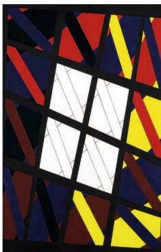
Jean-Pierre Maury, 16 RVB fenêtre noire, centre blanc, 1981 Schenking, 2004, BAM, Bergen - © Philippe de Formanoir

Het Fonds Thomas Neiryck neemt nu de taak op zich om het levenswerk van de mecenas te handhaven, te beschermen en tentoon te stellen, zoals hij het zelf had gewild. De Stichting heeft daarnaast een online inventaris van de collectie gepubliceerd ( www.cobraneiryck.be ), zodat de werken ook via die weg toegankelijk zijn voor liefhebbers en onderzoekers wereldwijd.