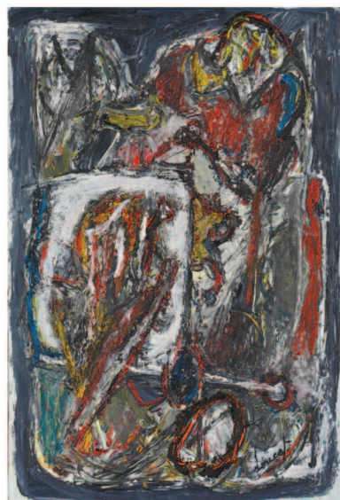
Jacques Doucet, Invitation à la nuit, 1979 Schenking, 2004, BAM, Bergen