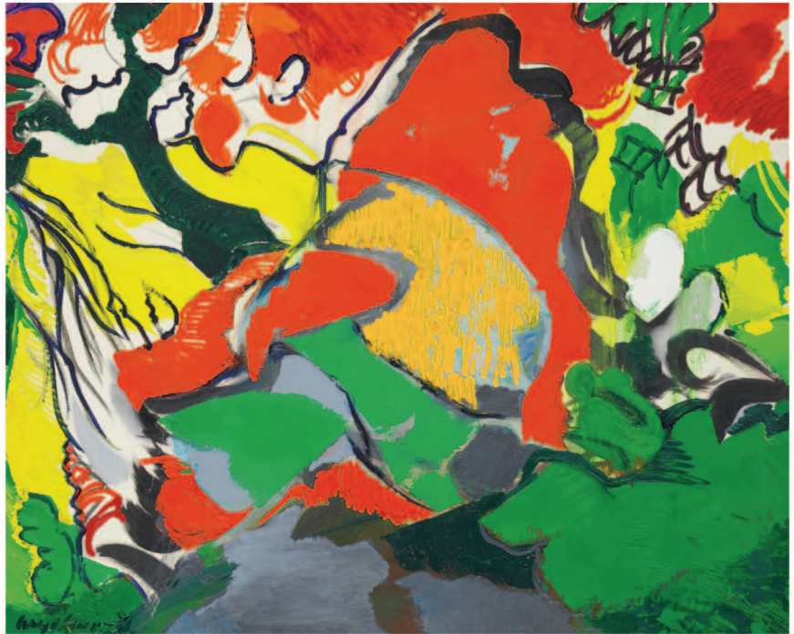
Maurice Wyckaert, Japanese Cherry tree, 1976 Schenking, 2004, BAM, Bergen