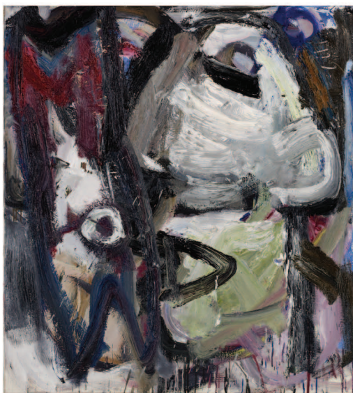
Philippe Vandenberg, De viseter, 1984 Schenking, 2004, BAM, Bergen