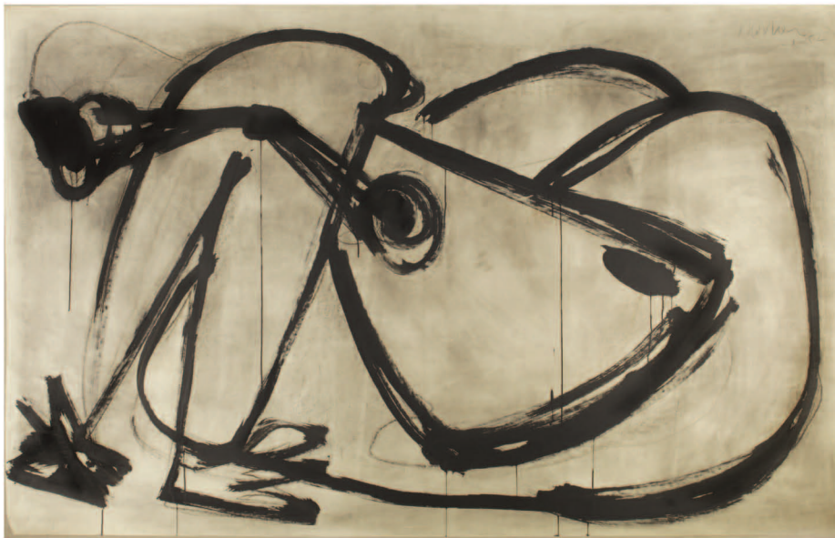
Antoine Mortier, Zonder titel, 1952 Schenking, 2004, BAM, Bergen